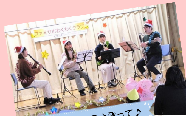
ステキな生演奏を聴いて♪歌って♪