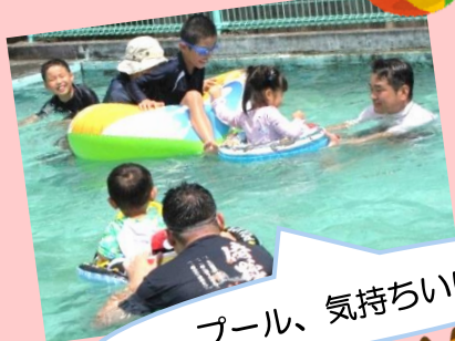
プール、気持ちいい~♪