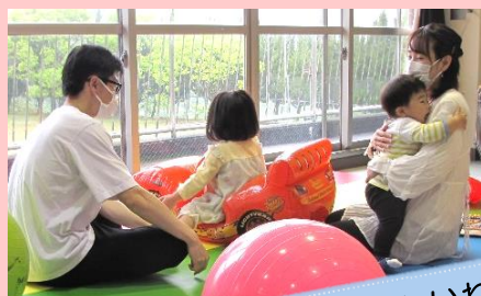
パパも参加♪楽しいね♪

今年度も、計6回のファミサポわくわくクラブに町内のたくさんの親子や会員さんが参加してくれました☆ 9月には『あったかふれあいセンター』さんとカレー作り、12月にはクリスマスまつりに『高知音楽塾クラリネットアンサンブル』の皆さんの生演奏、1月には『ヘルスメイト』さんと親子料理教室をして交流☆室内遊びは秋葉の宿や交流センターで、またお外遊びは森山プールや田村多目的広場で、みんなでワイワイ楽しみました♪ ご協力いただきました皆さん、そしてご参加くださった皆さん、ありがとうございました!!