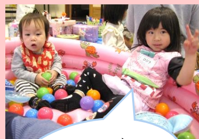
わあ~い♪ ボールプール、 楽しい~♪