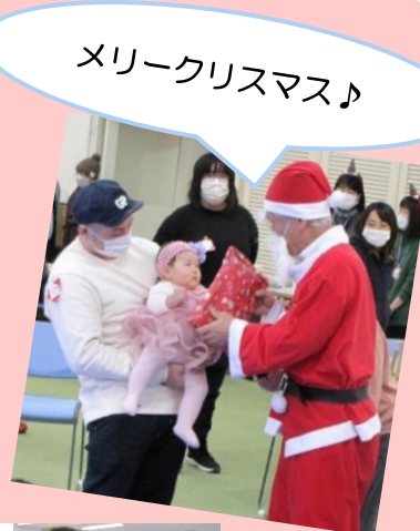
メリークリスマス♪