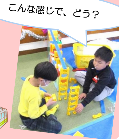
こんな感じで、どう?