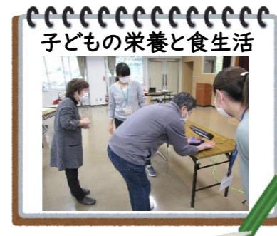
子どもの栄養と食生活