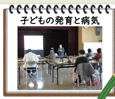
子どもの発育と病気