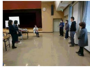
保育の心と子どもの遊び