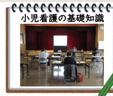
小児看護の基礎知識